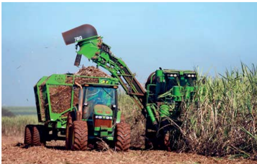
Sistema de colheita feito com a máquina atual resulta em tráfego pesado nos canaviais

Braunbeck ressalta que não houve evolução no sistema de manejo agrícola da cana na medida em que mudaram