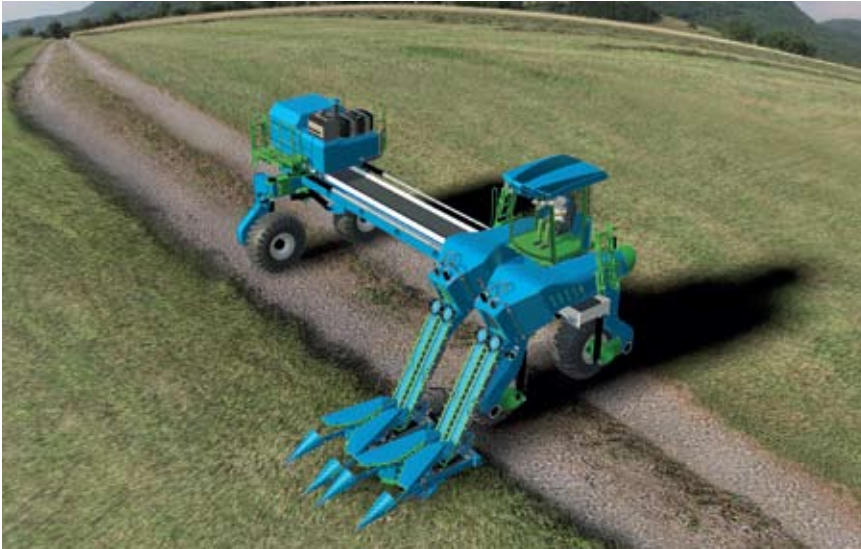
Maquete eletrônica da nova máquina com distância de 9 metros entre os eixos

no interior paulista, e apoio do Banco Nacional de Desenvolvimento Econômico e Social (BNDES) no valor de R$ 16 milhões. Em quatro anos o equipamento tem que estar testado e funcionando e a empresa parceira tem mais dois anos para colocar o produto à venda.