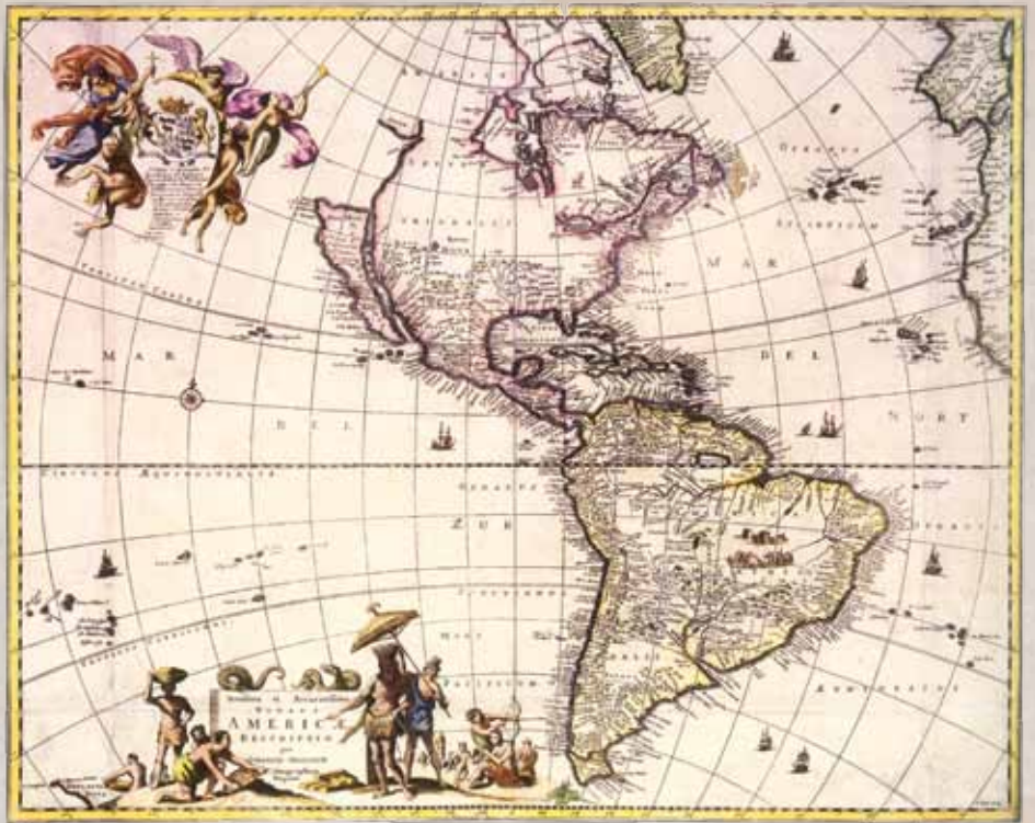
Novissima et Acuratissima Totius Americae Descriptio, John Ogilby, 1671, 43,5 x 54 cm

Era um império de grande racionalidade que tinha consciência de que os problemas locais exigiam soluções imediatas e produzidas localmente