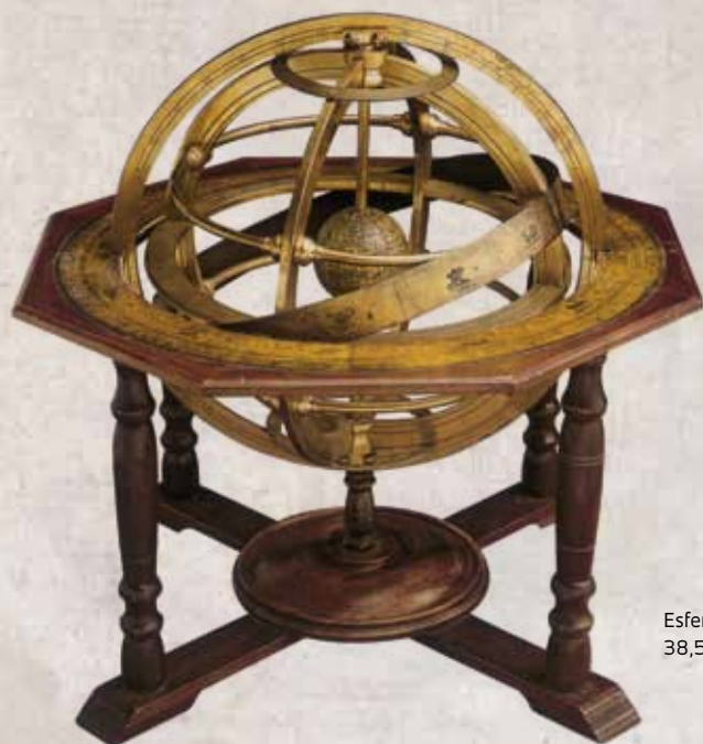
Esfera armilar, 38,5 x 38,5 cm

Ao se expandir, o Império Português sentiu a necessidade de trocar informações com mais