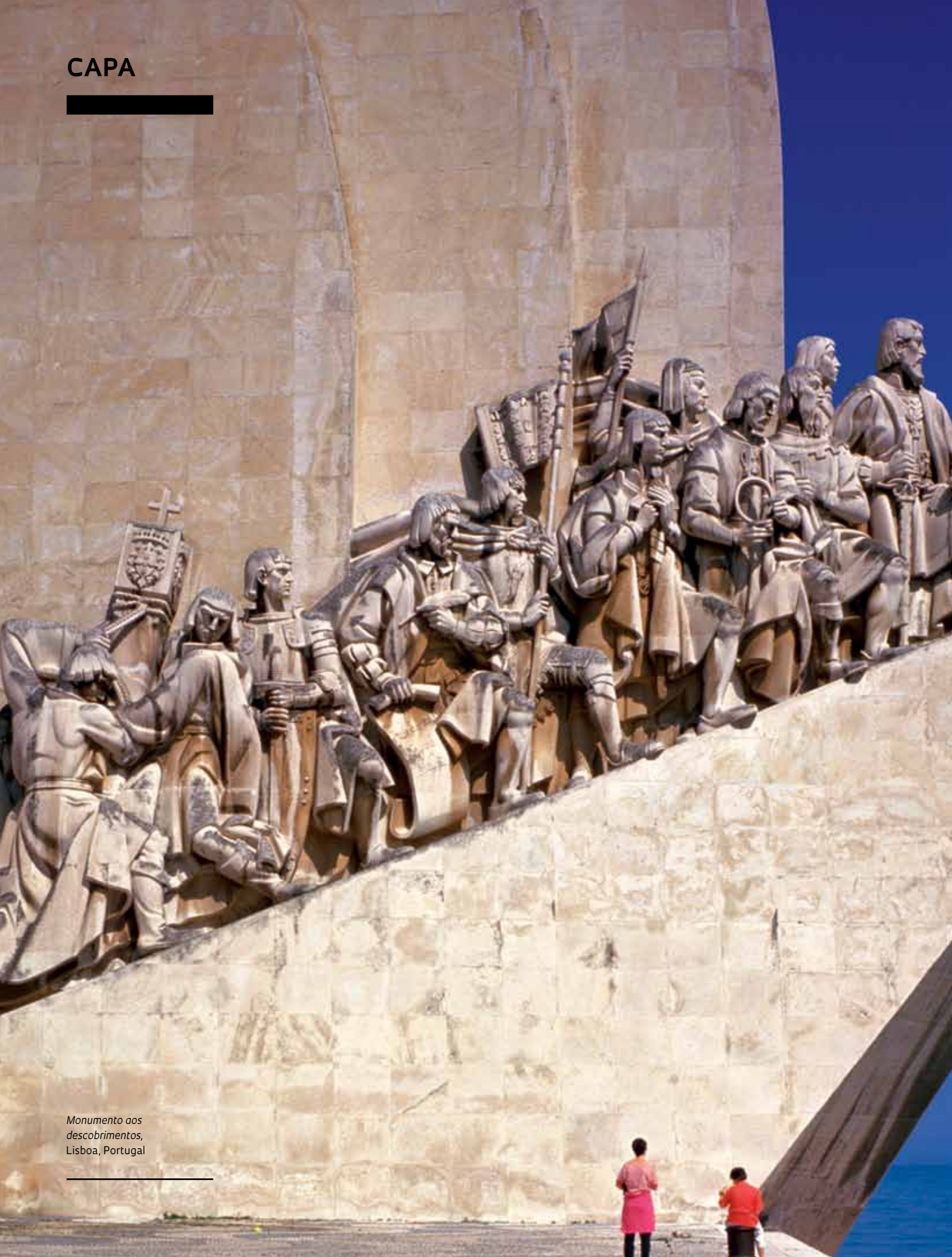
Monumento aos descobrimentos, Lisboa, Portugal