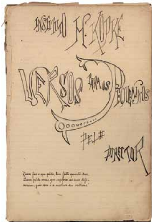
Capa de Versos para os pequeninos e, na outra página, trecho do poema O balanço : livro inédito escrito entre 1886 e 1897

crianças que recebem castigos severos por não gostar de banho ou de sopa. Patrícia encontrava o tradutor original, o desembargador Henrique Velloso de Oliveira (1804-1861), possivelmente um dos responsáveis pela adaptação do título original, Der Struwelpeter , cuja tradução literal resultaria em Pedro descabelado .