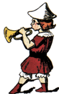
Ilustrações do livro João Felpudo, 1860