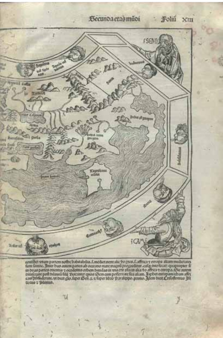
Exemplares de A crônica de Nuremberg (à esq.), de 1493, Evangelho grego (abaixo), do século XVI, e Compendio (à dir.), de 1541, integram acervo nacional de obras raras