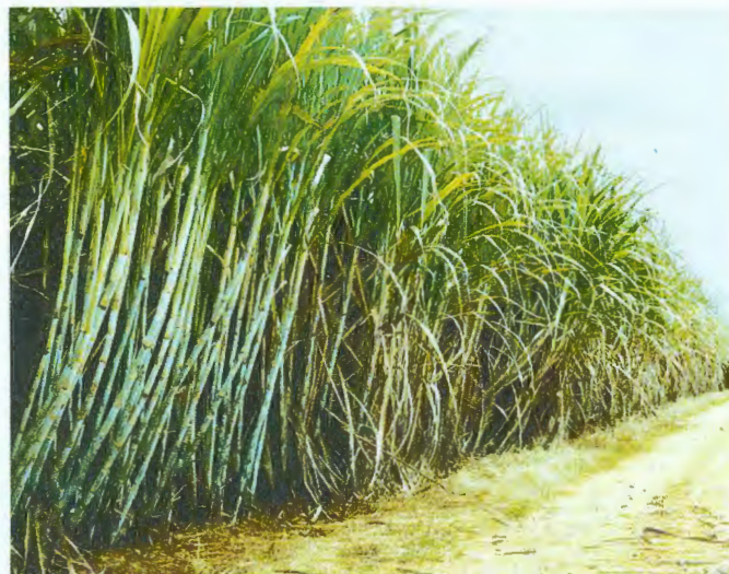
Pesquisa da cana: abertura para pesquisadores de outras áreas

Paulista de origem, o projeto Genoma Cana