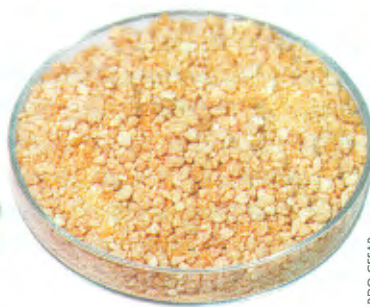
CLA modificado: composto adicionado à ração especial é responsável pelo “milagre”