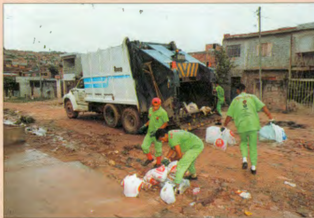
Lixo sendo recolhido: São Paulo terá projeto mais detalhado

Os valores que as cidades paulistas pagam atualmente às empresas coletoras de lixo têm uma variação enorme – de R$ 13 a R$ 120 por tonelada, com média de R$ 37. Agora, foi criado um instrumento para tentar solucionar a questão: um software que dá às prefeituras o controle dos parâmetros, especialmente custos, do serviço de coleta de lixo. Uma equipe da Divisão de Tecnologia de Transportes do Instituto de Pesquisas Tecnológicas (IPT) desenvolveu o software PlanLix a partir do projeto Determinação de Metodologias de Índices de Custos