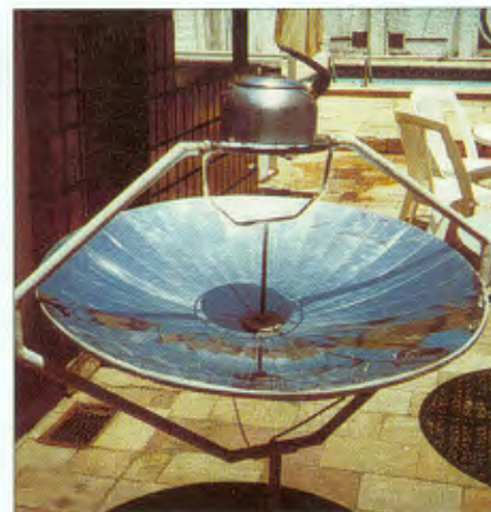
Fogão solar: uma panela de cada vez

nha 250 gramas de arroz em 38 minutos e 500 gramas de feijão em 1 hora e 40 minutos. “O aparelho é próprio para regiões áridas, onde há muito sol e pouca lenha”, diz Bezerra, que gastou R$ 150 para fazer o protótipo. Industrializado, ele acha que será possível vender a R$ 60 a unidade. Bezerra diz que há um empresário interessa-