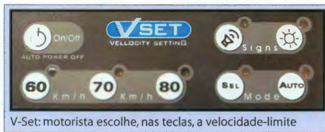
V-Set: motorista escolhe, nas teclas, a velocidade-limite