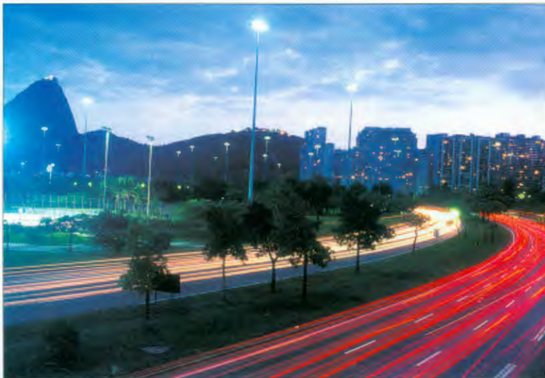
O Rio de Janeiro iluminado: pouco aproveitamento da luz natural