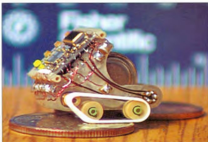
Esteiras e três baterias de relógio fazem o minirrobo se movimentar