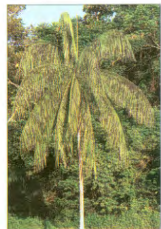
Açaí: cheio de qualidades