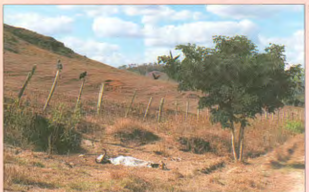
Noroeste do Rio: baixa produtividade e abandono

Um boi aqui, outro ali. Hoje, as pastagens cobrem quase a metade do Estado do Rio de Janeiro. Incluindo a área agrícola, cidades e capoeiras – vegetação secundária, que cresce em pastos abandonados ou florestas devastadas –, o espaço modificado pela ação humana atinge 73,6% do território fluminense, de acordo com o Índice de Qualidade de Vida (IQM) - Verde, do Centro de Informações e Dados do Rio de Janeiro (Cide). “O Rio tornou-se um mar de pastagens”, comenta Waldir Rugiero Peres, diretor técnico do Cide. Outro problema é que a produtividade do campo é muito baixa, aquém das necessidades da população do Estado. O cenário é ainda mais desanimador nos 13 municí-