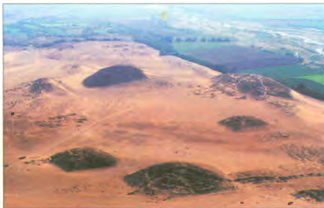
Ruínas de Caral: as estruturas indicam planejamento complexo

maia (século 4), a inca (século 13) e a asteca (século 15). A cidade tinha uma praça central, com seis construções ao redor. “Acredito que Caral só perdia em grandiosidade para cidades do antigo Egito”, disse o pesquisador Jonathan Hassa, do Field Museum. •