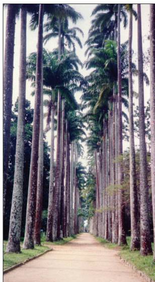
Jardim Botânico do Rio: apoio internacional