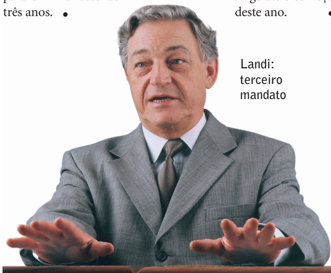
Landi: terceiro mandato

ria mecânica-eletricista em 1956 pela Escola Politécnica da Universidade de São Paulo (Poli/USP) e doutorado em engenharia química em 1972. Tornou-se livre-docente em 1981 e professor titular em 1986. Cursou pós-doutorado no Laboratório Nacional de Engenharia Civil de Lisboa, em 1975, e no Building Research Establishment, em Garston, Inglaterra, em 1975. Entre outros cargos, foi diretor da Poli (1989-1993) e presidente do Conselho Superior da FAPESP (1995-1996). É diretor presidente da Fundação desde agosto de 1996, função para a qual é reconduzido pela segunda vez para um mandato de três anos. •