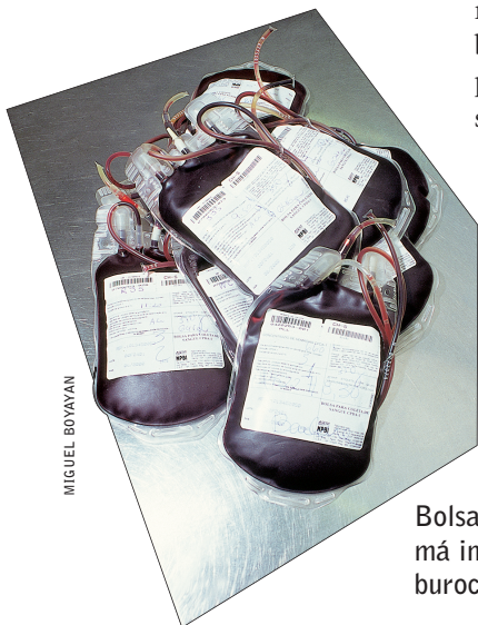
Bolsas de sangue: má informação e burocracia

conhecimento das práticas e métodos de coleta até a persistência, entre a população, de crenças como a de que doar sangue possa causar doenças e provocar perda ou ganho de peso. Já da parte dos bancos de sangue, o estudo identificou falta de infra-estrutura e equipamentos adequados para garantir a excelência do sangue colhido, funcionários mal treinados e horários de funcionamento restritos. Outro problema é que, na maioria dos países latino-americanos, o sangue costuma aparecer em cima da hora, mais de doadores remunerados e parentes de pessoas necessitadas de transfusão que de doadores voluntários. Isso dificulta o trabalho de triagem e pode contribuir para a proliferação dos casos de contaminação. •