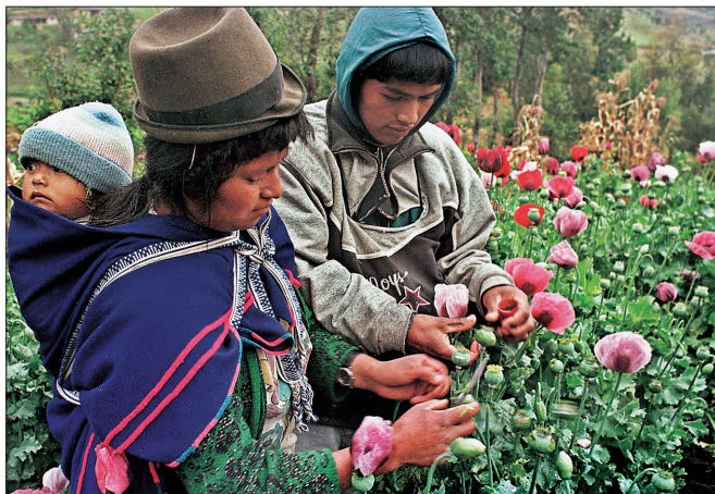
Índios colombianos trabalham em plantação de papoula

Aves de 115 espécies em extinção – entre elas a raríssima Eriocnemis miribilis , que por mais de 30 anos julgou-se desaparecida e foi redescoberta em 1997 – estão sendo expulsas de seu hábitat na Colômbia ( Nature , 2 de agosto). A conclusão é de um estudo que aponta como causa os desmatamentos em curso nos Andes colombianos – santuário dos pássaros ameaçados – por causa da proliferação das plantações ilegais que alimentam o tráfico de drogas. Segundo Maria Alvarez, autora do estudo e pesquisadora do Museu de História Natural de Nova York, o crescimento das lavouras de coca e papoula de ópio, matérias-primas para a produção de cocaína e heroína, é alarmante. Porém, a pesquisadora não responsabiliza nem os fazendeiros que se de-