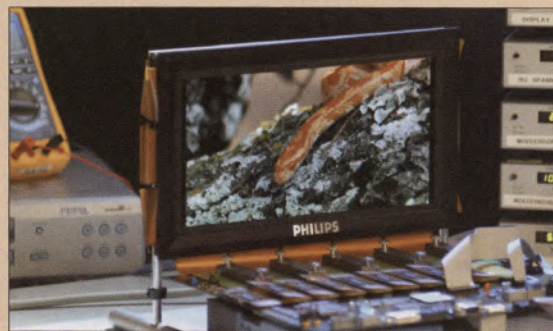
Telas mais nítidas e brilhantes: até no relógio

for Information Display, em Seattle, nos Estados Unidos, as novidades do setor. Entre as empresas que levaram inovações em Oled para Seattle está a Philips, que demonstrou o primeiro protótipo da PolyLed TV de 13 polegadas. A previsão