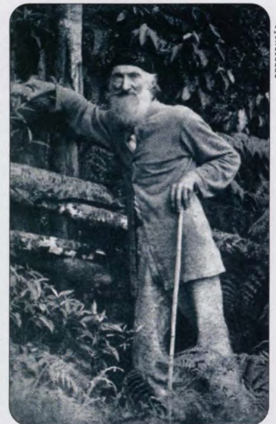
Müller: à vontade na floresta

D elirante, já perto da morte, o naturalista Fritz Müller só pensava em bromélias. Em frases soltas, desfiava as espécies já nomeadas e outras por estudar. Ele não falava dos crustáceos que ajudaram a firmar a teoria da evolução e encantaram Charles Darwin, nem das borboletas que imitam umas às outras para se livrar de predadores ou das orquídeas, todos objetos de intensa observação. Aos 75 anos, Müller tinha delírios febris com bromélias, donas de uma beleza selvagem que o levava a cultivá-las às dezenas em seu grande jardim à beira-rio, em Blumenau. Na Europa só era possível ver essa planta da família Bromeliaceae em herbários por ser exclusiva do continente americano (das mais