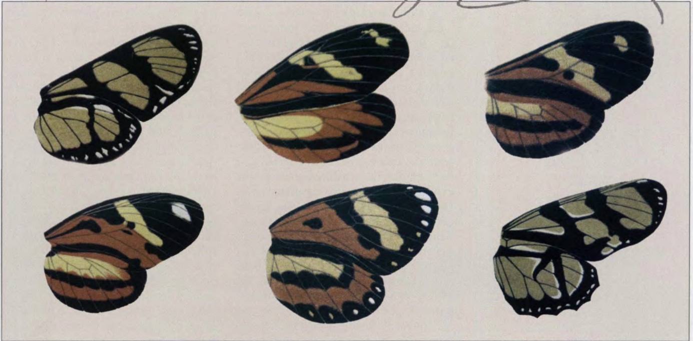
Asas de borboleta desenhadas pelo naturalista: estudo detalhado sobre mimetismo