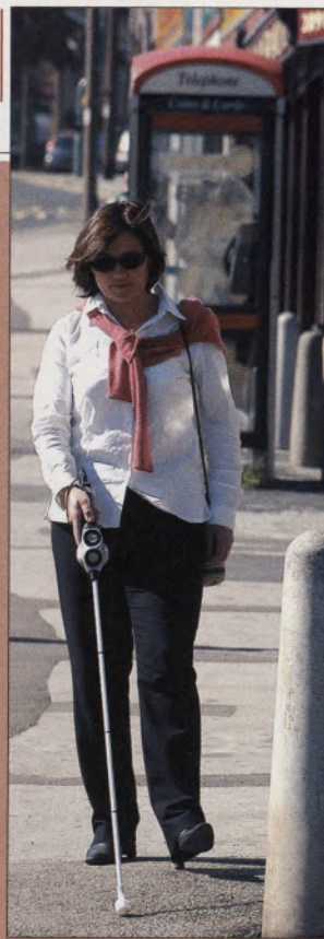
Cabo da bengala vibra ao encontrar obstáculo

no seu desenvolvimento. Dean Water, diretor da Sound Firesight e professor da universidade, disse à agência London Press : “Nós nos inspiramos na maneira como o navio percorre um trajeto no mar na escuridão, chamado de ecolocalização”. O sistema de orientação da navegação utiliza o radar e o sonar para localizar objetos que estão à frente. E se baseia no mesmo princípio usado por alguns tipos de morcego que emitem sinais de alta frequência e captam o eco gerado por