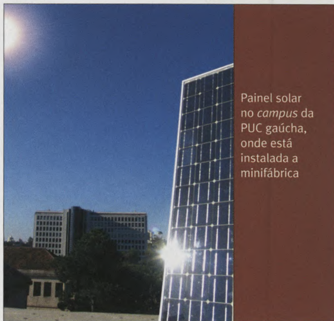
Painel solar no campus da PUC gaúcha, onde está instalada a minifábrica