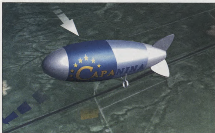
Dirigível vai ser usado para testar expansão de banda larga

Testes de um inovador sistema de banda larga conduzidos por um consórcio de pesquisadores europeus sediados na Grã-Bretanha poderão levar essa tecnologia para áreas rurais remotas, subúrbios e usuários em movimento por meio de um dirigível. Com esse tipo de veículo, os serviços de banda larga serão 200 vezes mais rápidos do que os oferecidos hoje. O consórcio Capanina, liderado pela Universidade de York, do norte da Inglaterra, vai ajudar nos ensaios testando as plataformas aéreas em alta altitude (HAPs) e o equipamento que será instalado no dirigível. •