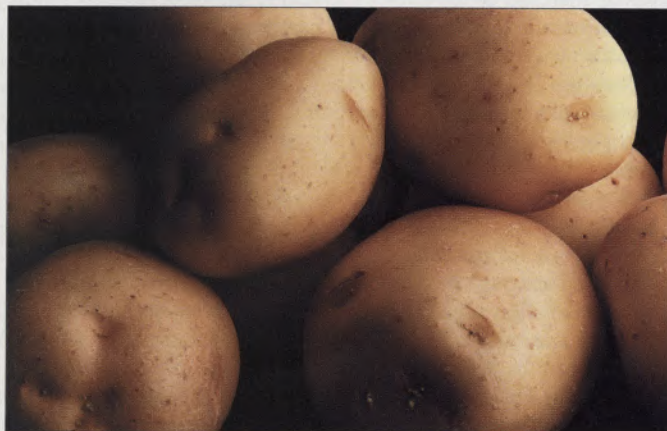
Proteção contra hepatite em batatas transgênicas

uma candidata ideal para programas mundiais de imunização. No Irã foi aprovado para consumo humano o primeiro arroz geneticamente modificado, desenvolvido por pesquisadores iranianos em parceria com filipinos. O cereal possui um gene que o faz resistente ao ataque de insetos. Isso evita a pulverização de inseticidas sobre a plantação. •