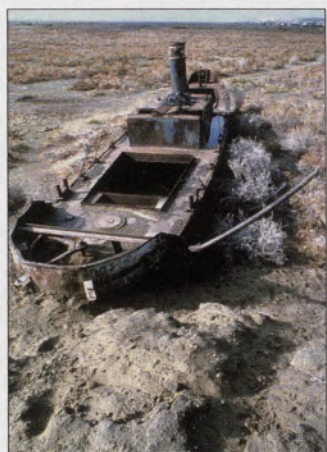
Mar de Aral: sem água

Começou a funcionar em Lanzhou, no noroeste da China, um centro internacional de pesquisas dedicado ao estudo de problemas ecológicos que resultam da interação de atividades humanas com fatores ambientais, tais como o aquecimento global, a chuva ácida e a desertificação. “Vamos tentar decifrar esses problemas por meio de projetos multidisciplinares, antes que eles causem desastres naturais”, diz Ye Qian, vice-presidente do centro, cientista baseado no Centro Nacional de Pesquisa Atmosférica dos Estados Unidos. Mais de 20 cientistas e bolsistas da China, Estados Uni-