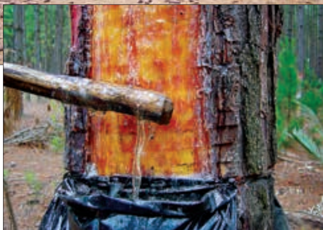
Plantação de Pinus elliottii do Instituto Florestal no município de Itapetininga, acima. Ao lado, extração da resina do tronco do pínus

nem sempre são garantia de perpetuação das mesmas qualidades. “Sempre aparecem grandes variações nos descendentes, porque a constituição genética é responsável por apenas uma parte da produção de resina, a outra parte é o resultado de aspectos ambientais como temperatura, solo, umidade e altitude”, diz Sebbenn. “Nessa segunda geração já conseguimos ganhos de até 40% em relação à produção original de resina.” Os resultados levaram a uma parceria entre o IF, a Aresb e a Escola Superior de Agricultura Luiz de Queiroz (Esalq) da Universidade de São Paulo (USP) em um projeto para a sistematização da clonagem de pínus para resina. “O objetivo é a formulação de um protocolo que possa ser usado pelos produtores para produção e uso do mate-