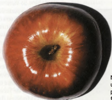
Novos usos para polpa da fruta

Detectar bactérias, vírus e outras substâncias perigosas em hospitais, aviões e outros lugares passíveis de contaminação poderá ser, em breve, tão simples como limpar uma superfície suja com papel-toalha. Um guardanapo biodegradável que funciona como um biossensor foi desenvolvido na Universidade Cornell, dos Estados Unidos. Nanofibras com elementos ativos compostos de biotina, uma parte da vitamina do complexo B, e uma proteína chamada estreptavidina que contém anticorpos para vários agentes biológicos e químicos são a matéria-prima do produto. Quando localiza um material contaminado, o guardanapo, feito de uma trama de fibras de não-tecido (usado em toucas e aventais hospitalares) e alumínio, poderá avisar do risco mudando de cor ou produzindo outro efeito. ●