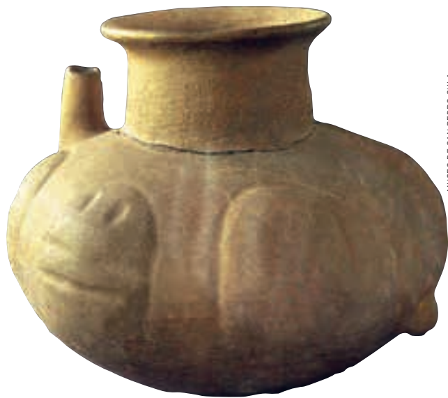
MUSEO DE SAN PEDRO SULA