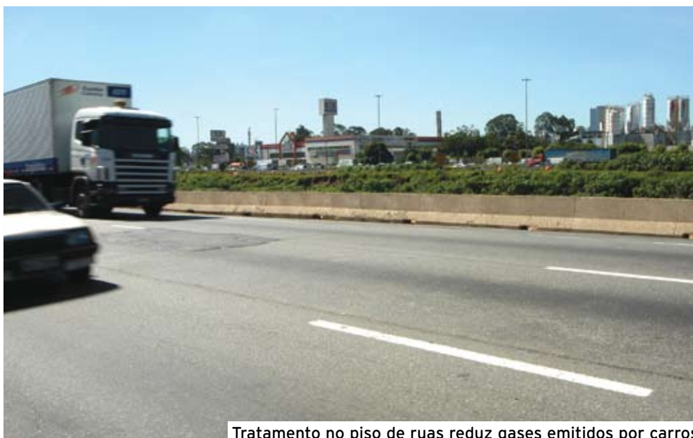
Tratamento no piso de ruas reduz gases emitidos por carros