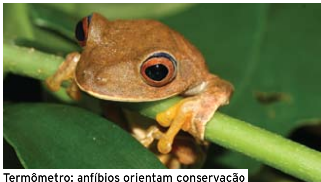
Termômetro: anfíbios orientam conservação

( H. semilineatus ) - com modelos ecológicos que buscavam reconstruir as condições climáticas 21 mil e 6 mil anos atrás ( Science ). Considerando os anfíbios como indicadores de mudanças ambientais válidos para outras espécies, os resultados indicam três áreas que se mostraram estáveis nesse período: a menor em Pernambuco, uma intermediária em São Paulo e a maior no sul da Bahia. Segundo os autores, as conclusões reforçam a urgência de estudar e preservar as florestas baianas, cuja fauna é menos conhecida e potencialmente mais rica que a do Sudeste. Para o coautor Célio Haddad, da Unesp, esse resultado não tira a importância de outras áreas nem elimina a necessidade de estudar mais espécies.