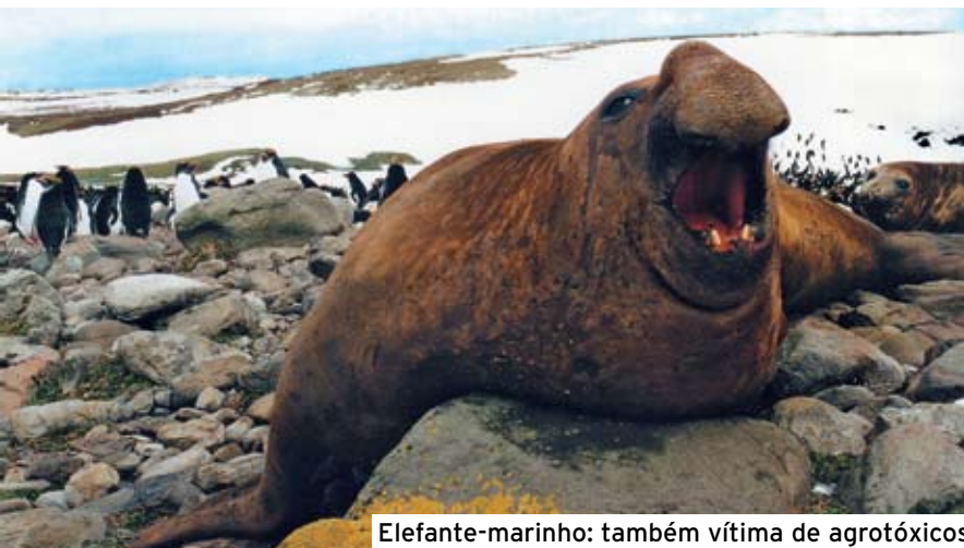
Elefante-marinho: também vítima de agrotóxicos