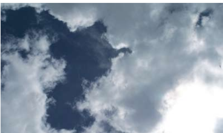
Observatório terá informações ambientais e de saúde

A Fundação Oswaldo Cruz (Fiocruz) e o Instituto Nacional de Pesquisas Espaciais (Inpe) anunciaram a criação do Observatório Nacional de Clima e Saúde (Observatorium),