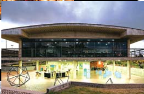
Instalações do Espaço Ciência: 100 mil visitantes em 2008