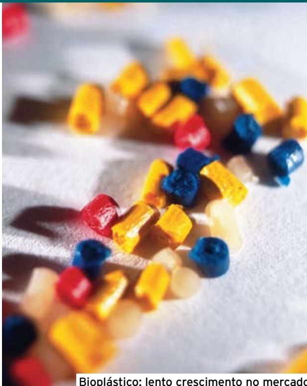
Bioplástico: lento crescimento no mercado