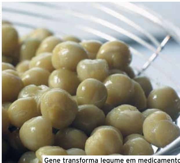
Gene transforma legume em medicamento

células solares orgânicas, também conhecidas como DSC (Dye-sensitized Solar Cells). A fibra óptica capta a luz do Sol e as nanoestruturas se responsabilizam por convertê-la em eletricidade. Uma importante vantagem da tecnologia é que ela permite a produção de geradores fotovoltaicos dobráveis, carregáveis e “disfarçados” em construções.