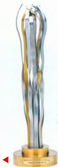
Troféu: escultura do artista Vlavianos

Novo. Todos receberão R$ 300 mil e um troféu feito pelo artista plástico Vlavianos em cerimônia na Sala São Paulo, na capital paulista, em junho próximo.