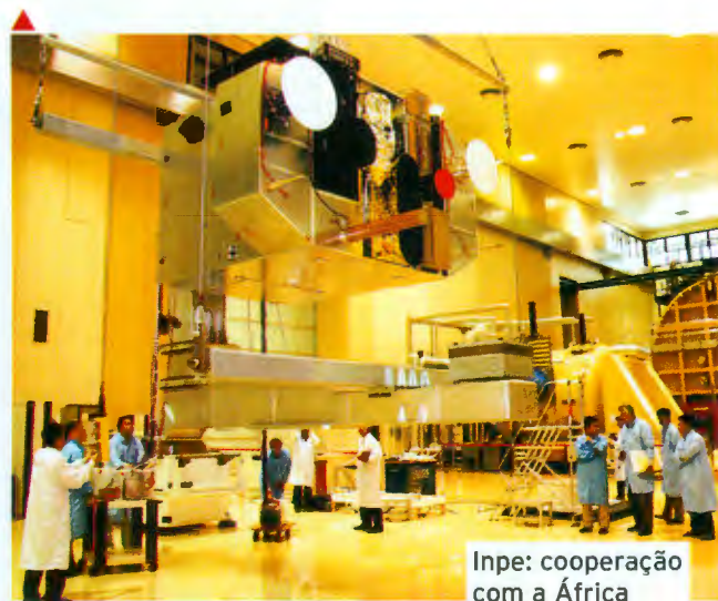
Inpe: cooperação com a África

entendimento com a Agência Espacial Sul-Africana (Sansa, na sigla em inglês), que permitirá a recepção na África do Sul das imagens do satélite sino-brasileiro