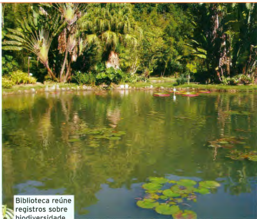
Biblioteca reúne registros sobre biodiversidade