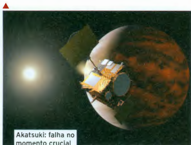
Akatsuki: falha no momento crucial

A Agência de Exploração Aeroespacial do Japão (Jaxa) mergulhou numa crise no dia 6 de dezembro, quando a sonda Akatsuki fracassou em sua tentativa de penetrar na órbita de Vênus sete meses após ter partido da Terra. A próxima chance só virá em seis anos, mas a nave talvez não tenha combustível suficiente para sobreviver até lá. A hipótese mais provável é que a sonda não conseguiu desacelerar o suficiente para entrar na órbita, segundo a agência local Kyodo . Foram investidos 25,2 bilhões de ienes (US$ 300 milhões) no desenvolvimento da Akatsuki, que viajou 520 milhões de quilômetros desde seu lançamento em 21 de maio. O fracasso, que compromete um ambicioso programa de pesquisa sobre a atmosfera de Vênus, é o terceiro problema mecânico enfrentado pela Jaxa em missões a outros astros do sistema solar. Em 1998, uma válvula defeituosa causou uma perda de combustível