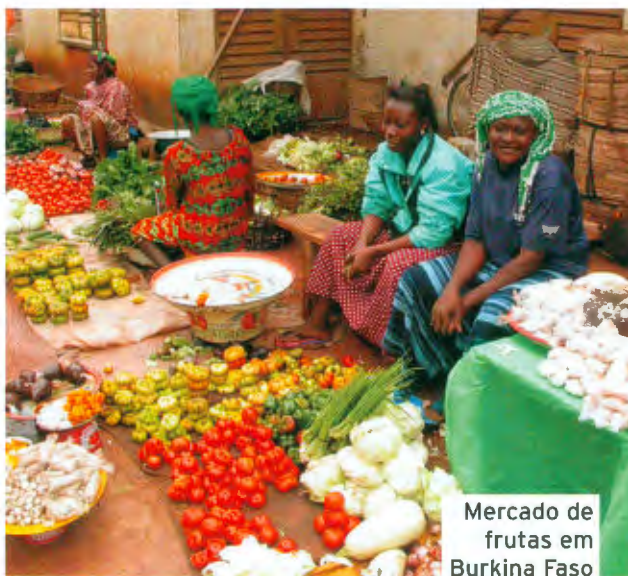
Mercado de frutas em Burkina Faso

tópico sobre a metodologia da pesquisa, espera-se que os resultados, a discussão e os resumos tragam dados novos”, diz Harold Garner, especialista em bioinformática do Instituto Politécnico de Virgínia, nos Estados Unidos. Uma análise feita por Garner na base de artigos Medline mostra que a republicação de papers está caindo desde 2006. Ele acredita isso à vigilância dos editores de periódicos, que usam softwares para checar os artigos propostos.