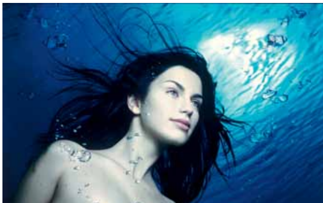
2º lugar AXE, de Maurício Nahas