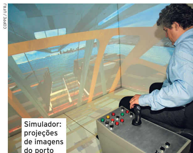
Simulador: projeções de imagens do porto

alunos. Um outro programa mostrava atrações turísticas da cidade.” O sistema televisivo foi instalado por meio da tecnologia Power Line Communications (PLC), que utiliza os fios da rede elétrica para a transmissão de TV. Chamado de System for Advanced interactive Digital Television and Mobile Services in Brazil (Samba), o projeto contou também com mais 10 instituições como o Instituto Fraunhofer, da Alemanha, e a empresa Axel Technologies, da Finlândia.