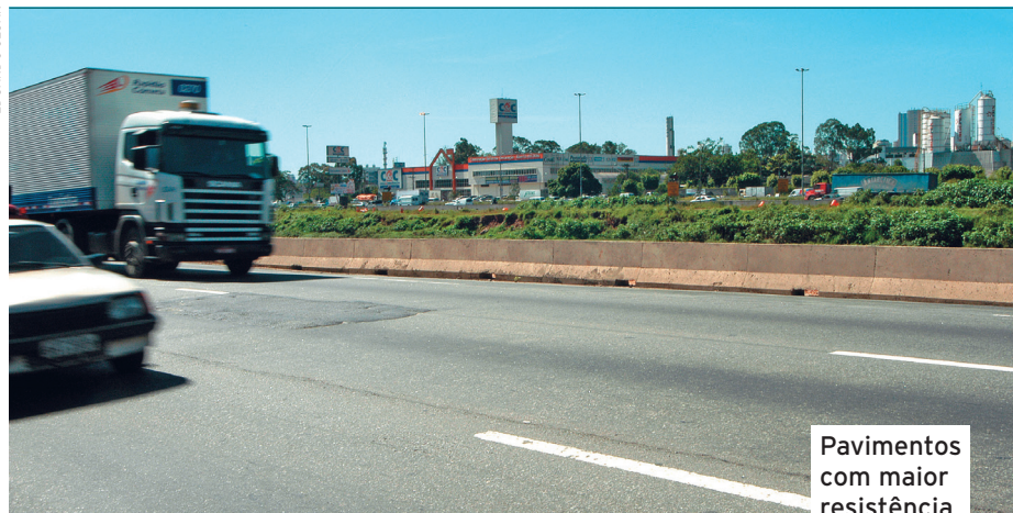
Pavimentos com maior resistência