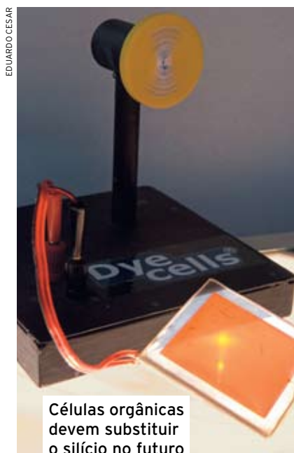
Células orgânicas devem substituir o silício no futuro