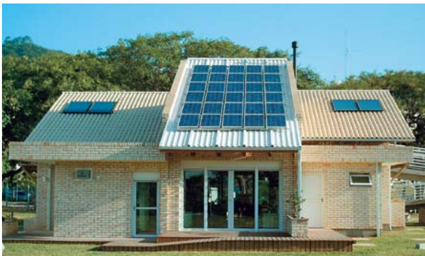
Casa eficiente em Florianópolis: experimento na UFSC

da eletricidade cobrada pela Eletropaulo, em São Paulo, e quase a mesma em Belo Horizonte. Esse cálculo é feito levando-se em conta o tempo de vida de 25 anos de um painel, mais os gastos com manutenção e a taxa de incidência solar do local (que muda de acordo com o mês e a região do país). O resultado é um valor a ser comparado com a energia cobrada pelas empresas distribuidoras.