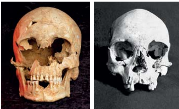
Crânios de Luzio (à esq.) e de Luzia: traços semelhantes aos dos atuais aborígenes australianos e africanos