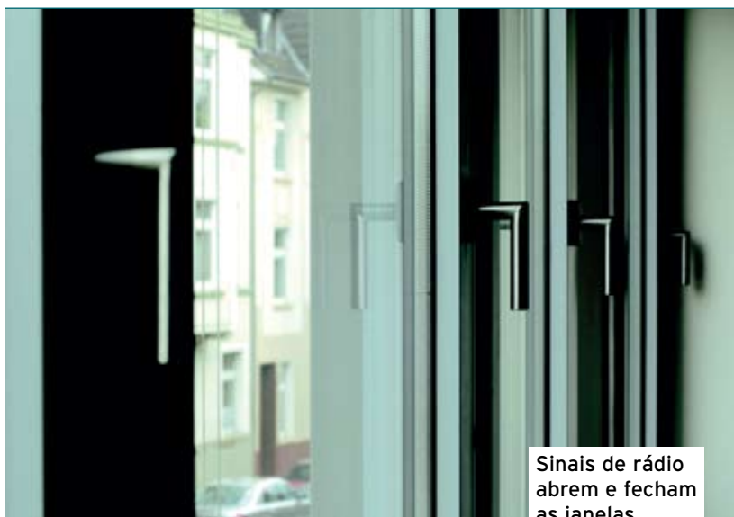
Sinais de rádio abrem e fecham as janelas