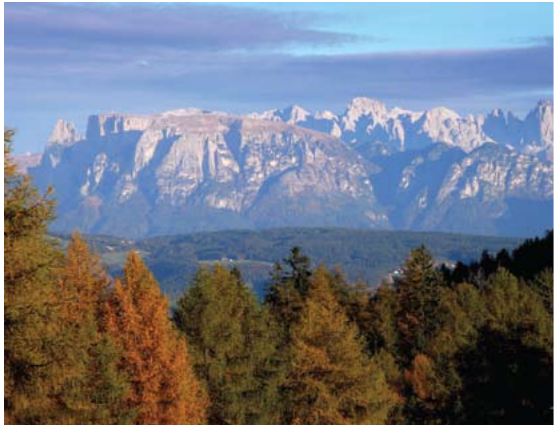
Floresta de pinheiros nos Alpes italianos: mais espécies vegetais adaptadas ao calor

aumentou no pico das montanhas. A alteração é mais evidente justamente nos lugares em que os termômetros mais subiram na década passada, a mais quente desde que se iniciaram os registros sistemáticos de temperaturas. “Os resultados são claramente significativos, não estamos falando de uma só montanha”, diz Ottar Michelsen, da Universidade Norueguesa de Ciência e Tecnologia, um dos autores do trabalho. “Quando tantas montanhas em tantas regiões mostram um efeito, é porque se trata de coisa grande.” Os dados reforçam o receio de que certas espécies dos Alpes correm o risco de desaparecer ou ao menos ter suas áreas de ocorrência diminuídas em razão das mudanças climáticas.