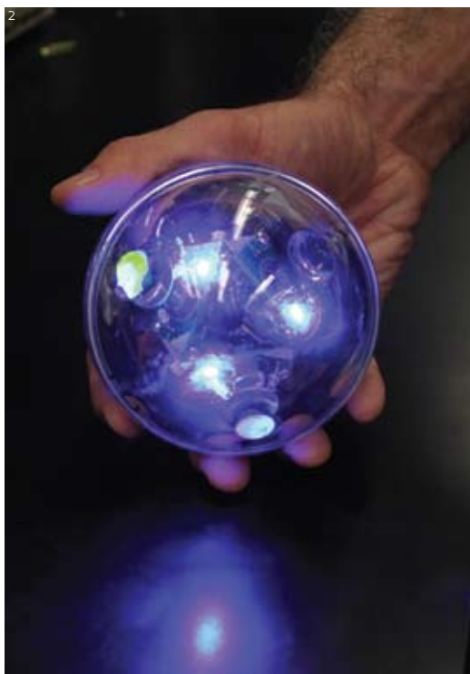
SensorBots: flashes azuis transmitem informações do fundo do mar

Vera Pereira-Chioccola, examinou 73 cães capturados em Mirandópolis, no interior de São Paulo, e constatou que 60 tinham leishmaniose, 40 abrigavam pulgas e quase todos, carrapatos. Segundo análises de DNA, a taxa de infecção pelo protozoário Leishmania , causador da doença, foi de 28% nas pulgas e acima de 50% nos carrapatos. Estudos de RNA indicaram que havia protozoários vivos no interior de ninfas de carrapatos retirados de cães infectados.