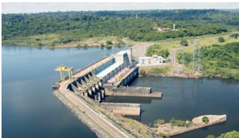
Laser e sensores medem temperatura do gerador da Hidrelétrica de Samuel, em Rondônia

colocados sensores impressos no núcleo da fibra para fazer a medição. A vantagem desses dispositivos é que eles são isolantes, não conduzem eletricidade como os fios de cobre e, portanto, são imunes ao campo elétrico existente próximo aos geradores e outros equipamentos da usina, além de uma fibra substituir vários fios de cobre. “O próximo passo é usar, num projeto com a Petrobras, as fibras com sensores para medir os gases na exploração de petróleo no fundo da camada pré-sal, num local onde não é possível usar corrente elétrica em razão do risco de explosões”, diz Werneck.