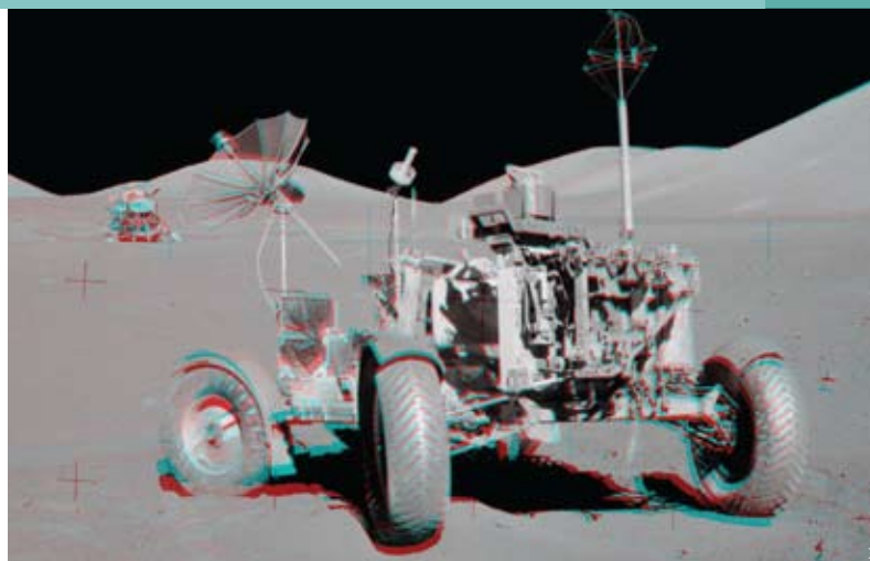
Colinas lunares de 3,9 bilhões de anos cercam o veículo usado pela tripulação da Apollo 17