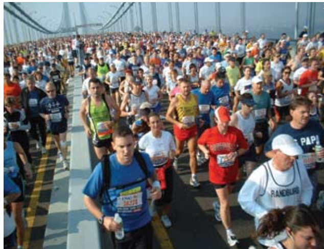
Prova de longo percurso: risco de parada cardíaca em maratona não é maior do que em corrida casual