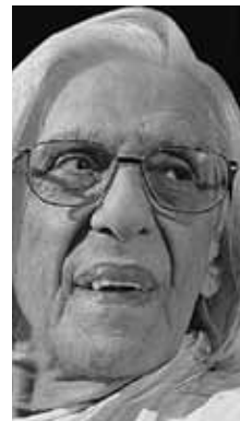
CULTURA Ferreira Gullar Poeta