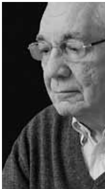
CIÊNCIA GERAL Iván Izquierdo Neurocientista