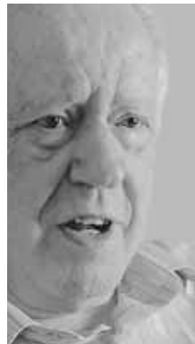
CULTURA Affonso Ávila Poeta e ensaísta