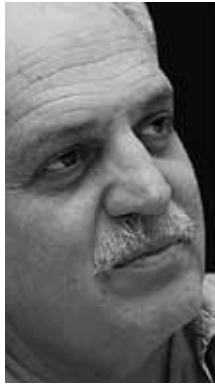
CIÊNCIA APLICADA AO MEIO AMBIENTE Carlos Nobre Climatologista