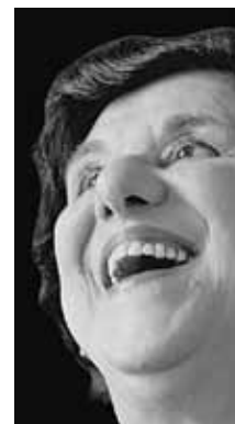
CULTURA Ruth Rocha Escritora