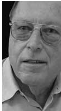
CIÊNCIA APLICADA Ernesto Paterniani Geneticista de plantas