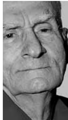
CULTURA Ariano Suassuna Dramaturgo