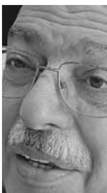
MEDICINA Adib Jatene Cardiologista