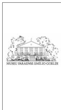
CIÊNCIA APLICADA AO MEIO AMBIENTE Museu Paraense Emílio Goeldi