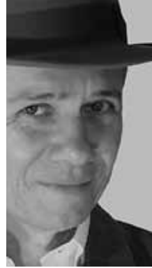
CULTURA Antonio Nóbrega Músico e dançarino