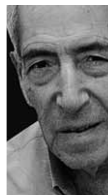
CIÊNCIA APLICADA AO MEIO AMBIENTE Aziz Ab'Sáber Geógrafo