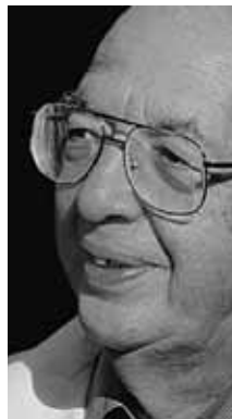
CIÊNCIA GERAL Isaías Raw Bioquímico