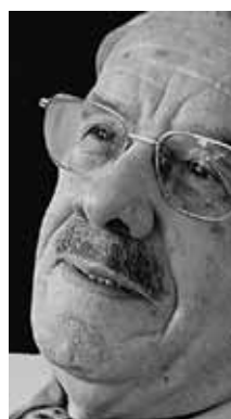
CULTURA Fábio Lucas Crítico e ensaísta