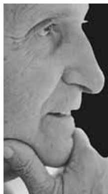
CIÊNCIA GERAL Sérgio Mascarenhas Físico