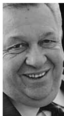
CIÊNCIA APLICADA À ÁGUA Galizia Tundisi Biólogo