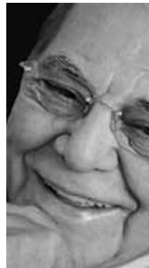
MEDICINA Ivo Pitanguy Cirurgião plástico