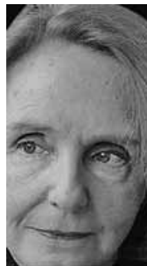
CULTURA Lya Luft Escritora