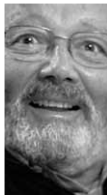
CIÊNCIA APLICADA À ÁGUA Aldo Rebouças Geólogo