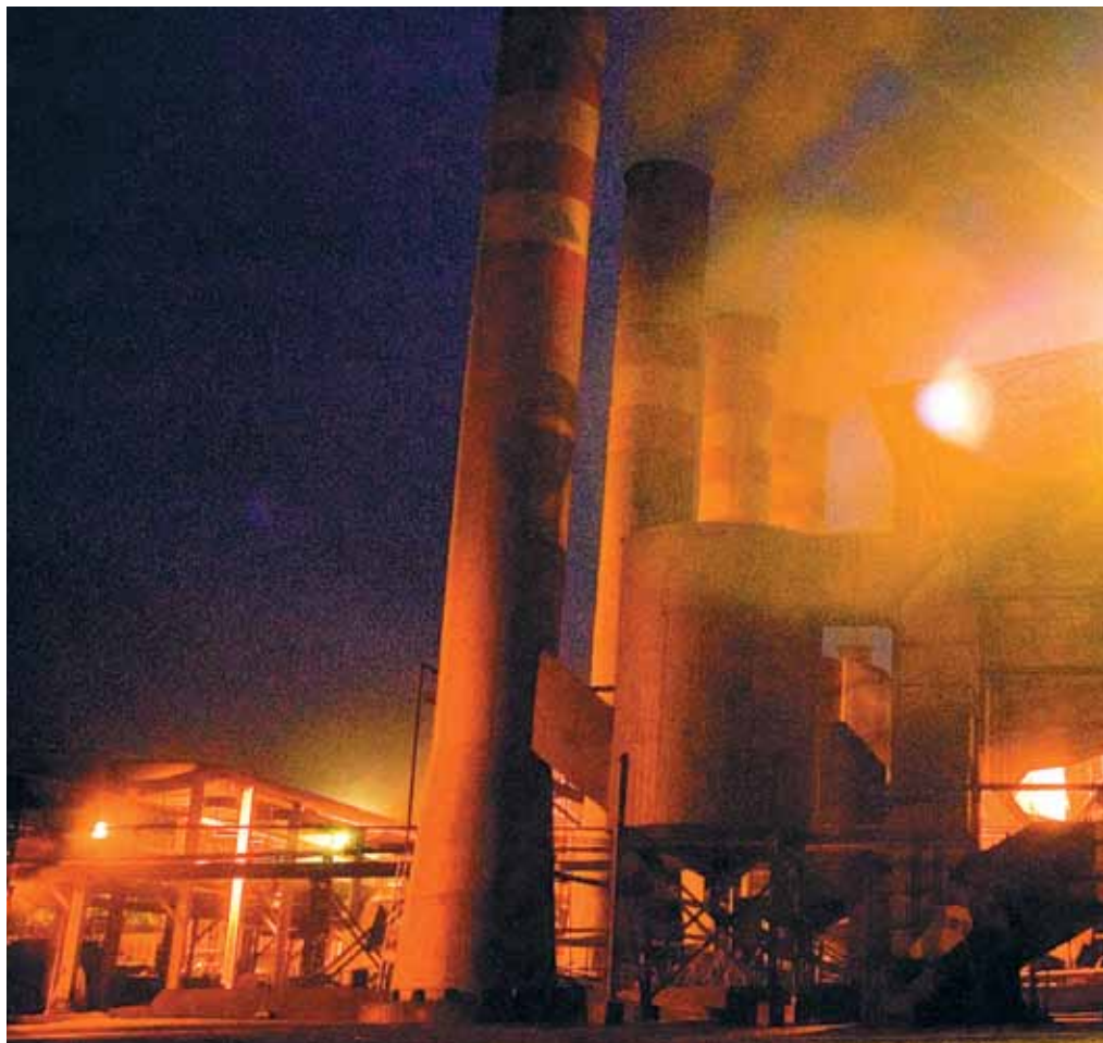
Caldeiras da Usina Santa Elisa, em Sertãozinho (SP): produção de energia elétrica com bagaço de cana

Um salto no interesse pela pesquisa em cana e etanol aconteceu em abril de 1999, com o advento do Genoma Cana, que mapeou 250 mil fragmentos de genes funcionais da cana ( ver reportagem à página 54 ) e se caracterizou pela interação com o setor privado. Após o encerramento do programa, o interesse das empresas pela pesquisa em bioenergia não arrefeceu. Em 2006, a FAPESP, em parceria com o BNDES, firmou um convênio com a Oxiteno, do grupo Ultra, para o desenvolvimento de projetos cooperativos em que se investiga desde o processo de hidrólise enzimática do bagaço da cana para a obtenção de açúcares até a produção de etanol de celulose. No ano seguinte, a Dedini Indústrias de Base celebrou convênio com a FAPESP para financiar projetos sobre técnicas de