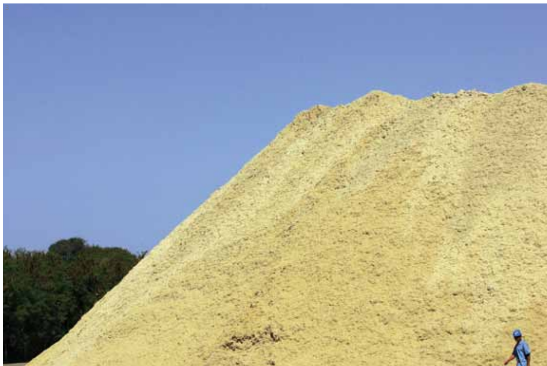
Montanha de bagaço de cana na Usina Costa Pinto, em Piracicaba (SP): extração de etanol da celulose poderá multiplicar a produção do combustível brasileiro

FAPESP dentro do Bioen. Em 2022, no cenário traçado pelo instituto, a área de lavoura de cana deve ocupar 10,5 milhões de hectares, ante 8,1 milhões de hectares em 2009. O crescimento de 30% no canavial deve se dar na região Sudeste, principalmente em áreas de pastagem de criação de gado bovino, e na região Centro-Oeste, onde deve substituir áreas tradicionais de plantio de grãos e de pastos. “Hoje, os pecuaristas produzem mais carne por hectare. Em 1996, foram produzidas 6 milhões de toneladas de carne, em 184 milhões de hectares. Dez anos depois, a produção somou 9 milhões de toneladas de carne, em 183 milhões de hectares. O rebanho, no período, saltou de 158 milhões para 206 milhões”, diz a pesquisadora Leila Harfuch, do Icone. “As pastagens entre 2009 e 2022 devem cair cerca de 5 milhões de hectares, acomodando parte da expansão de grãos e cana.”