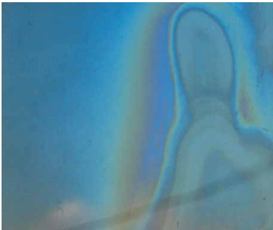
O mistério da santa, agora resolvido: forma humana em uma vidraça em Ferraz de Vasconcelos (SP)