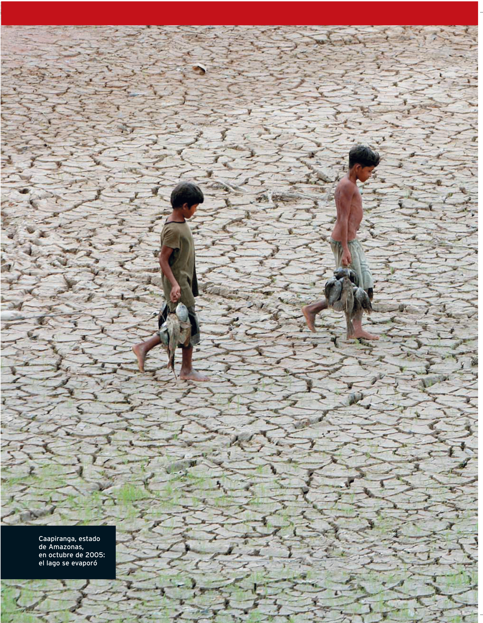
Caapiranga, estado de Amazonas, en octubre de 2005: el lago se evaporó