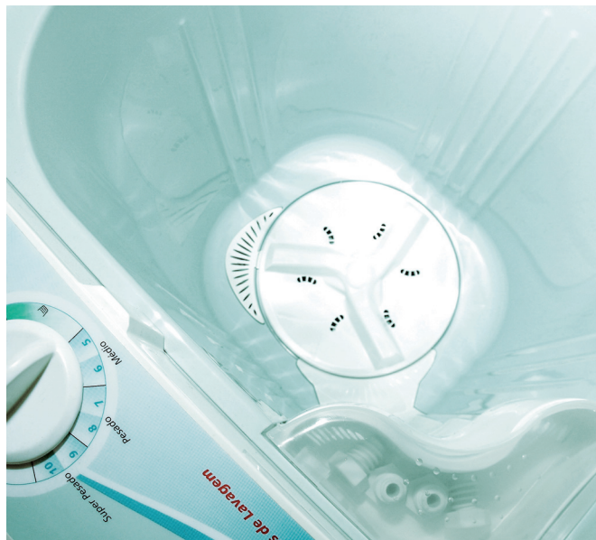
Cuba de lavadora con polipropileno y plata: efecto bactericida

Los trabajos en nanotecnología en Suzano son coordinados por el químico Adair Rangel, que inició el estudio y el desarrollo de nuevos materiales nanoestructurados hace solamente tres