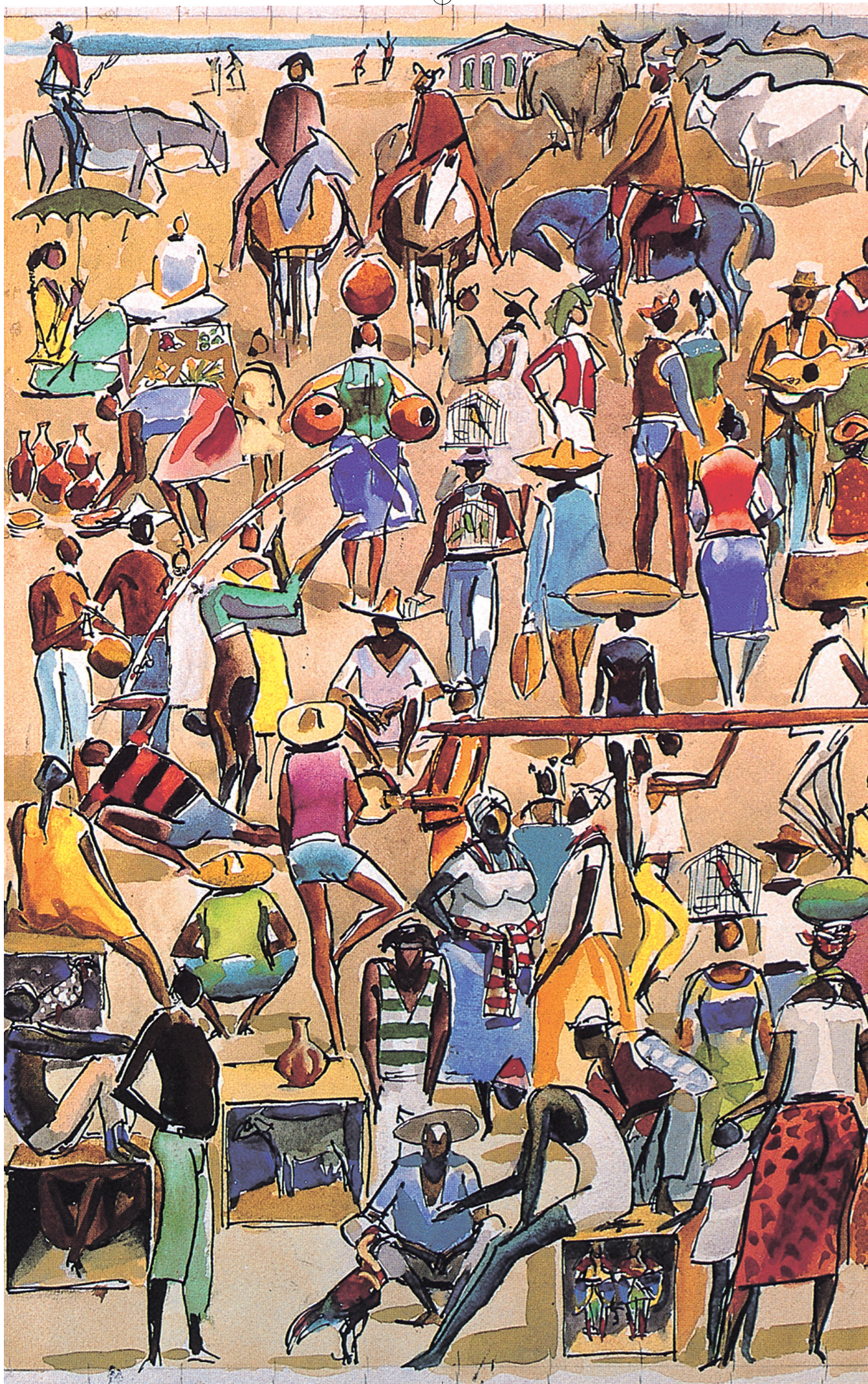
CARYBE, FEIRA, 1984