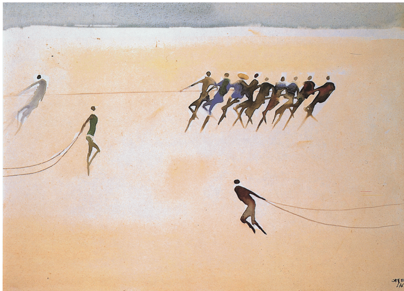
CARYBÉ, A PESCA DE CHARREL, 1976