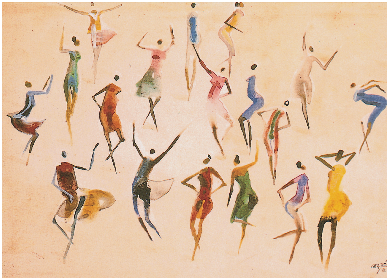
CARYBÉ, AS BAILARINAS, 1961

La primera medida, sugiere él, es acabar con las cuerdas. “La cuerda es