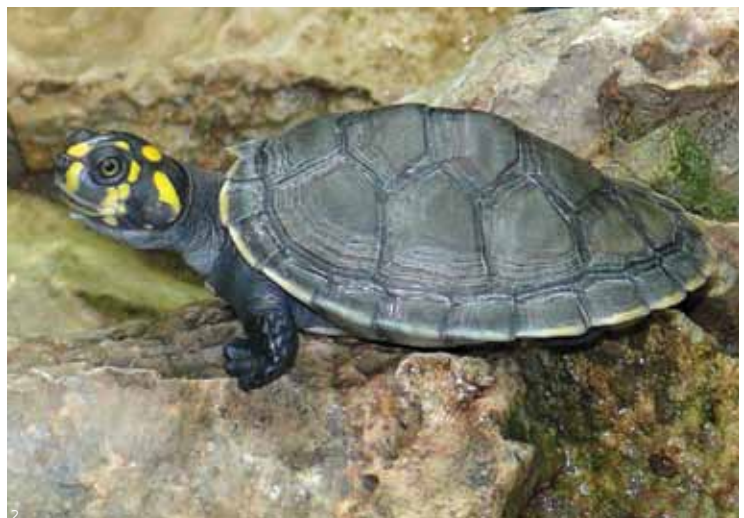
Tracajá: populações em declínio por causa do consumo da carne e dos ovos

eclodiram após os 63 dias em média de incubação. Houve perdas de ovos na maioria (80%) dos ninhos, causadas principalmente (75%) por moradores das comunidades próximas, tanto nas áreas protegidas das reservas como na área urbana. A predação por animais silvestres foi a causa da perda dos ovos em 2,7% dos ninhos e 1,7% dos ovos foi perdido por causa da variação sazonal dos níveis do rio. Uma das conclusões desse levantamento é que a proximidade dos ninhos de comunidades urbanas e ribeirinhas é o principal fator de perda de ovos e, conseqüentemente, da redução das populações de tracajás. Os autores desse estudo alertam para “a urgente necessidade de ações estratégicas para conservação e manutenção dos estoques naturais dessa tartaruga com relativa vulnerabilidade na região”.