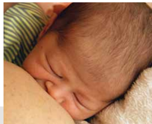
Nos primeiros meses depois do parto, aleitamento reduz risco de depressão