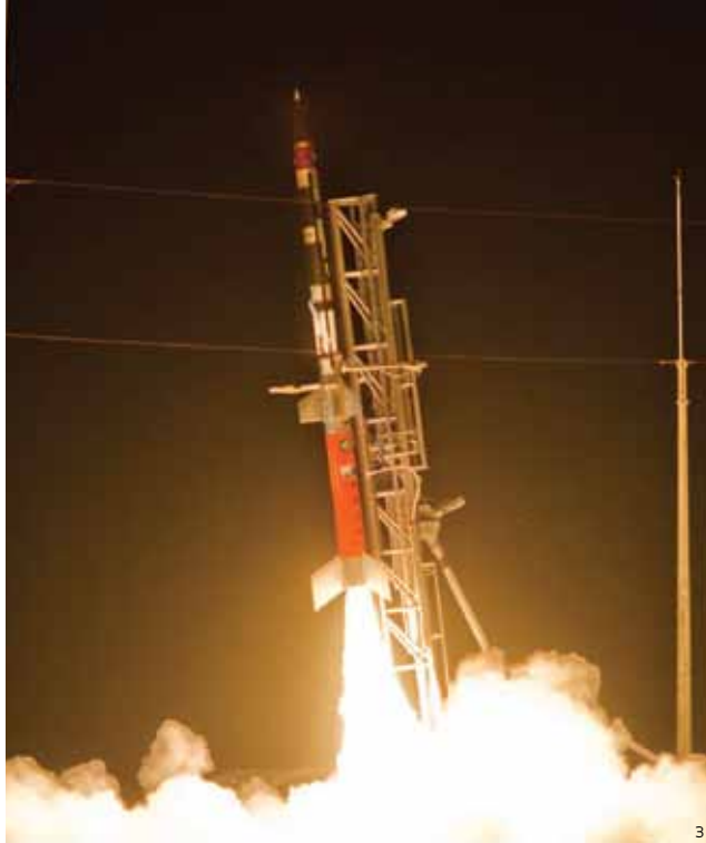
Lançamento do VS-30 V13, no Maranhão: voo a mais de 100 quilômetros de altitude para coleta de dados