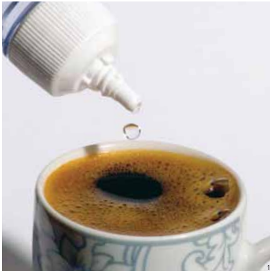
Adoçante artificial: altera a microbiota intestinal e produz intolerância à glicose