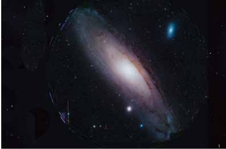
Andrômeda, galáxia em forma de disco (acima), e as 30 galáxias geradas a partir de colisões de galáxias menores (ao lado)