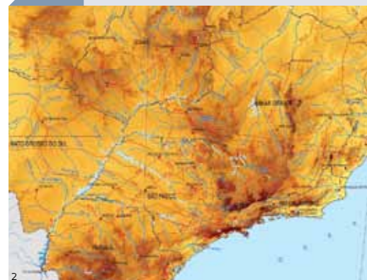
Dados para agricultura, zonas industriais e recursos hídricos

O mapa digital dos solos brasileiros, lançado pela Embrapa Solos, do Rio de Janeiro, surge como uma importante ferramenta para auxiliar nas políticas públicas de conservação. O sistema utiliza dados ambientais disponíveis de solo, relevo, clima e outros, associando-os a modelos matemáticos e estatísticos para prever informações que não foram medidas, mas que estão correlacionadas por meio das variáveis ambientais que determinam a formação dos solos. Um levantamento similar feito pelas técnicas tradicionais demandaria anos de trabalho dos pesquisadores, além de um alto custo. O mapeamento digital pode ser utilizado para responder à necessidade de informações para o desenvolvimento de atividades como manejo de solos na agricultura, execução de zoneamentos ambientais, manejo de recursos hídricos e planejamento de uso da terra.