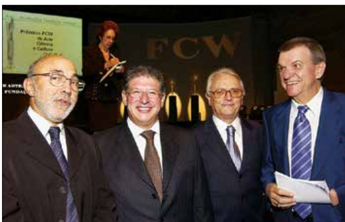
Integrantes do júri que escolheu os vencedores (primeira fila), do Conselho Curador e da diretoria da FCW