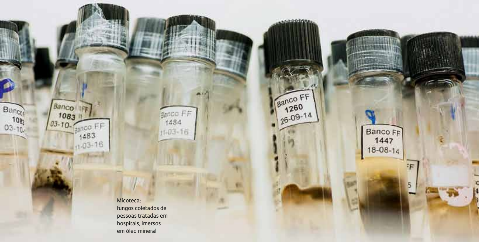
Micoteca: fungos coletados de pessoas tratadas de hospitais, imersos em óleo mineral

Não é simples descobrir como os fungos adquirem a capacidade de causar infecções – a chamada virulência – e resistência a medicamentos. Em seu laboratório na Faculdade de Ciências Farmacêuticas da Universidade de São Paulo (USP) de Ribeirão Preto, Gustavo Goldman, biólogo de formação, verificou que Aspergillus fumigatus pode proliferar nos pulmões por meio de estratégias distintas, por causa da capacidade de escapar das defesas do organismo e dos principais antifúngicos, os azoles. Segundo ele, uma hipótese para explicar a resistência aos azoles é o uso de fungicidas para eliminar espécies danosas à agricultura em áreas próximas à cidade, que favoreceu a seleção e a disseminação de variedades nocivas às pessoas. “Fungos são organismos essencialmente oportunistas”, diz ele. “Variedades importantes para a reciclagem de carbono na natureza podem causar doenças se encontrarem hospedeiros debilitados. Além disso, têm muita plasticidade genotípica e grande poder de adaptação a diferentes ambientes.”