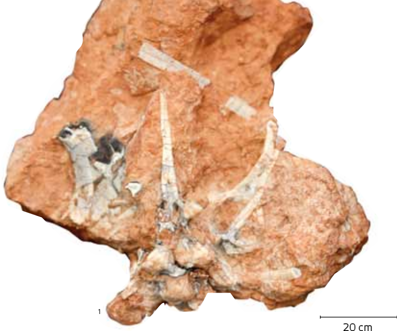
Ossos do crânio do dinossauro Saturnalia tupiniquim , que viveu 230 milhões de anos atrás

serem avaliados pela simples observação dos registros fósseis”, informa.