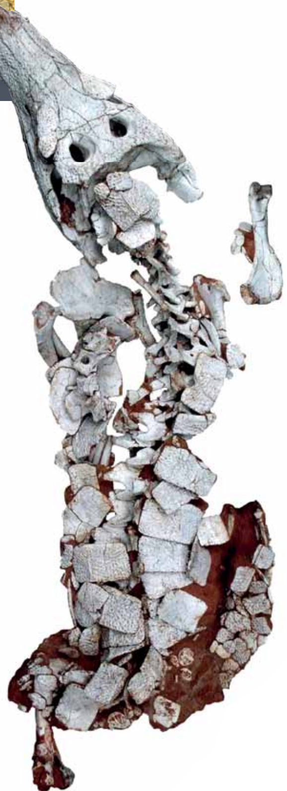
Imagens de tomografias do crocodilo Montealtosuchus arrudacamposi e esqueleto montado com os fósseis encontrados do réptil

O crocodilo extinto, que media entre 1,30 metro (m) e 1,50 m, pesava de 25 a 50 quilos. A reconstituição digital sugere que as articulações dos ossos da sua cintura escapular e do seu esqueleto apendicular anterior, que auxilia na sustentação e na movimentação corporal, distribuíam-se de modo a permitir que as