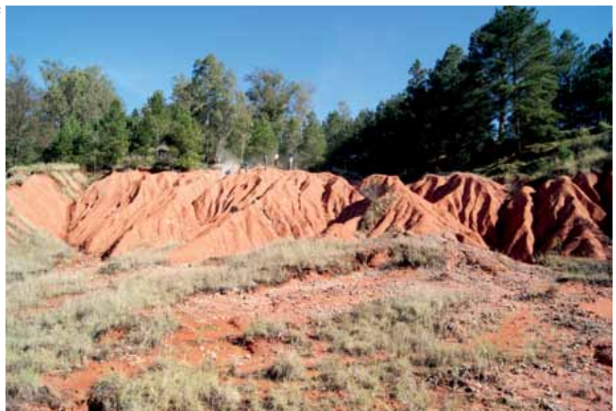
Sítio paleontológico gaúcho onde foi encontrado o dinossauro