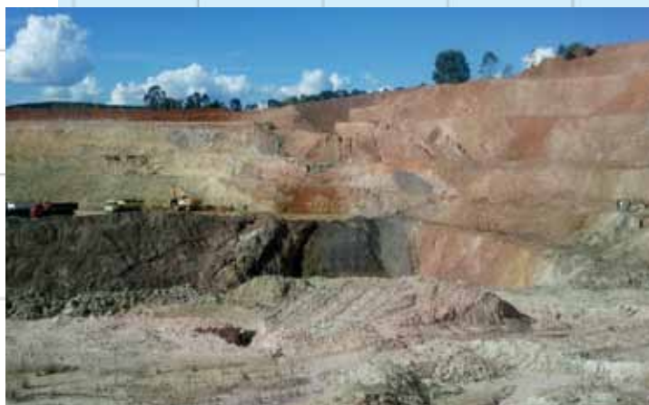
A amostra de rocha rica em grafita foi retirada da parte escura da cavidade desta mina de Itapeperica, em Minas Gerais

FONTES ADAPTADO DE G. ZHAO (MAPA MAIOR) E WILSON TEIXEIRA (MAPA MENOR)