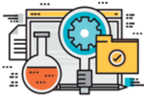
PUBLICAÇÕES EM FUNÇÃO DE DISPÊNDIOS EM P&D (US$ MILHÕES) 4

Os resultados das atividades de P&D nas principais universidades norte-americanas em 2016 estão fortemente associados ao volume de dispêndios. As três universidades paulistas foram incluídas no gráfico para publicações e a Unicamp no de startups, como referências 3 .