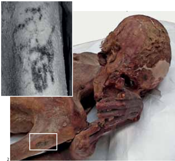
Corpo mumificado do Homem de Gebelein A, visto sob luz natural, e as tatuagens no braço direito observadas sob luz infravermelha