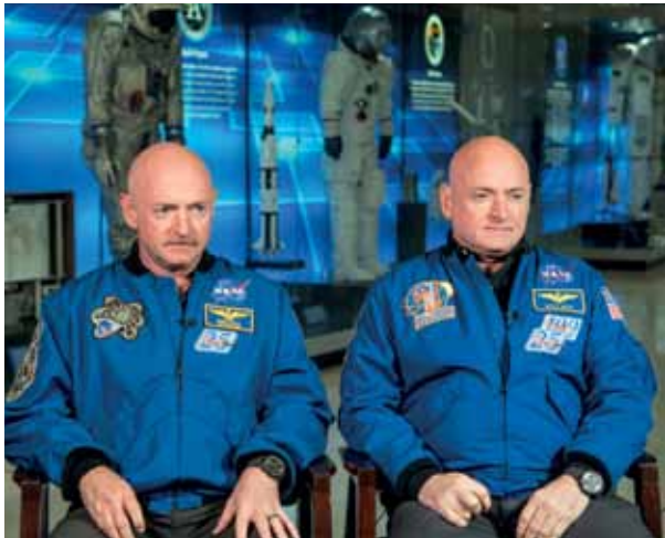
O astronauta Mark Kelly (à esq.) e seu irmão gêmeo, Scott, que passou quase um ano no espaço