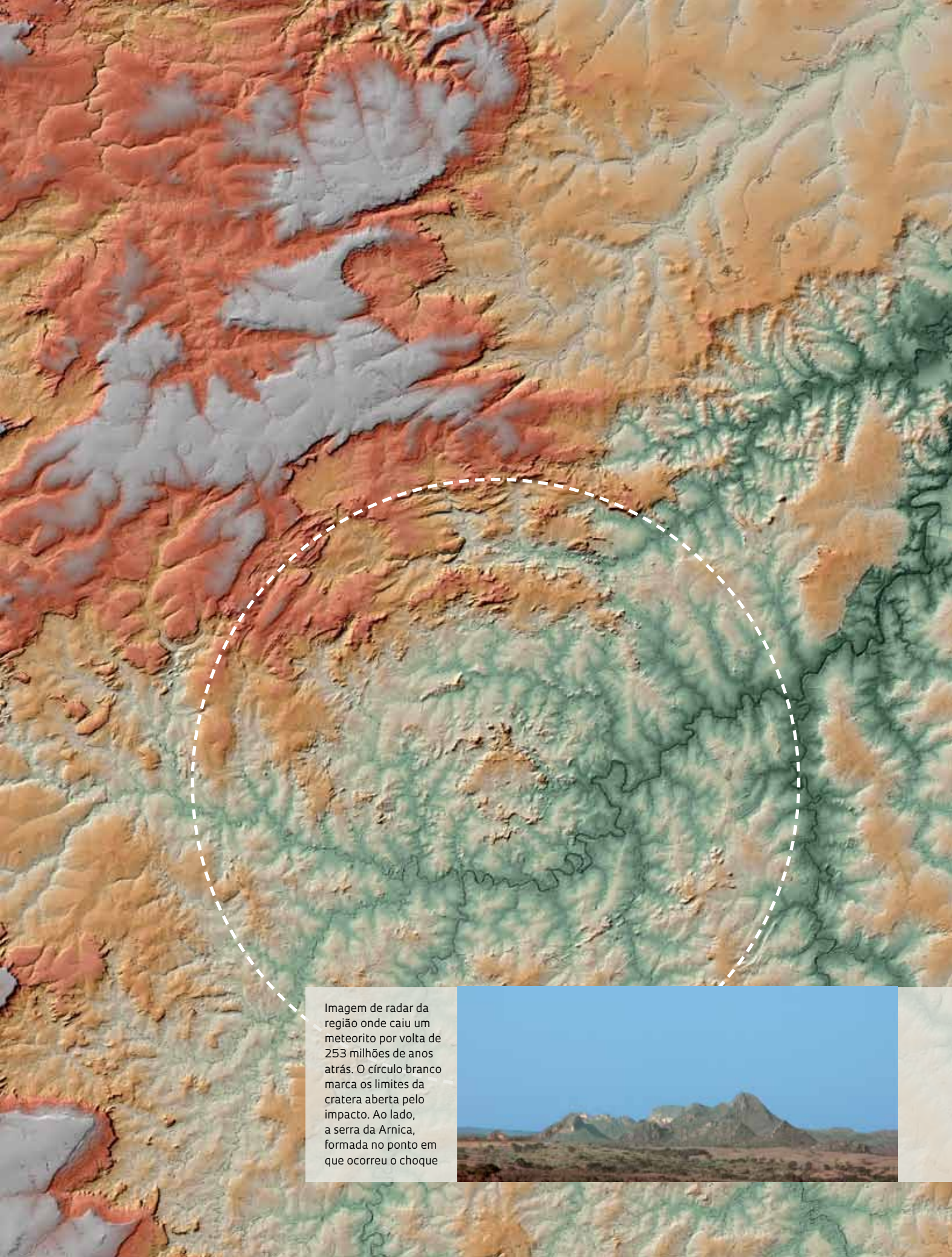
Imagem de radar da região onde caiu um meteorito por volta de 253 milhões de anos atrás. O círculo branco marca os limites da cratera aberta pelo impacto. Ao lado, a serra da Arnica, formada no ponto em que ocorreu o choque