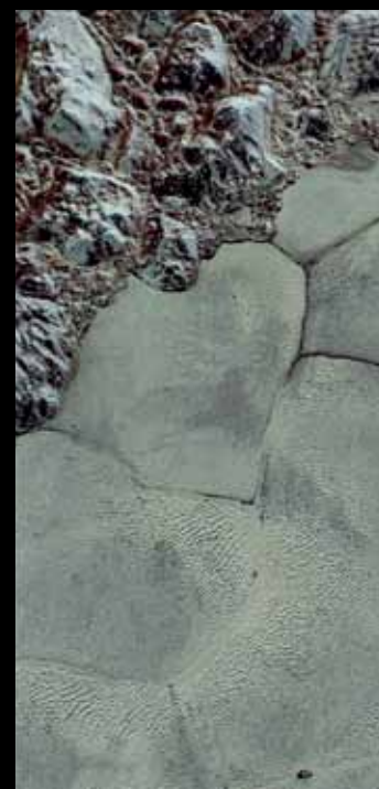
Região de dunas na planície Sputnik, em Plutão (detalhe abaixo)

temperaturas baixíssimas (230 graus Celsius negativos), atmosfera rarefeita e ventos que raramente ultrapassam 40 quilômetros por hora, insuficientes para levantar do chão os grãos finos de metano congelado e empilhá-los nas dunas. Analisando as imagens da New Horizons e fenômenos que originam dunas em outros planetas do Sistema Solar, um grupo internacional de pesquisadores, do qual participa o físico brasileiro Eric Parteli, parece ter encontrado a explicação. Grãos microscópicos de metano seriam ejetados do chão quando o Sol ilumina Sputnik e aquece um pouco os grãos de nitrogênio congelado, fazendo-os passar para o estado gasoso ( Science , 1º de junho). O fenômeno, chamado sublimação, forneceria energia suficiente para arrancar grãos de metano, que seriam, então, transportados pelos fracos ventos de Plutão. “A inspiração para esse modelo é o que ocorre em Marte, onde a sublimação do gelo que cobre as dunas ejeta os grãos de areia”, explica Parteli, pesquisador da Universidade de Colônia, na Alemanha.