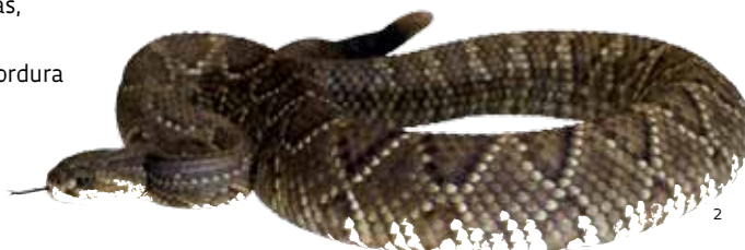
Extraída do veneno da cascavel, a crotamina reduziu o ganho de peso de roedores

crotamina reduziu em 50% o colesterol total, aumentou em 50% o nível do colesterol de alta densidade (HDL) e diminuiu à metade as taxas de colesterol de baixa densidade (LDL) e de triglicérides, associadas a maior risco cardiovascular. Outro efeito foi a redução de gordura branca, que armazena calorias, e o aumento da quantidade de gordura marrom, que queima calorias (ver Pesquisa FAPESP nº 139).