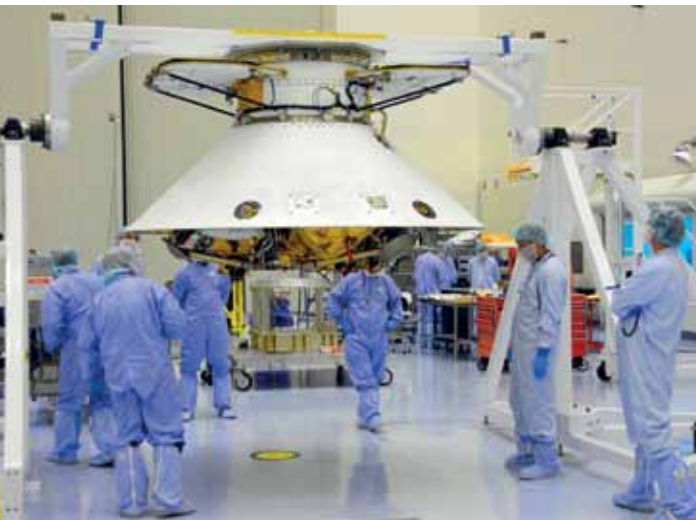
Sonda espacial Phoenix em testes em sala limpa no Centro Espacial Kennedy, na Flórida