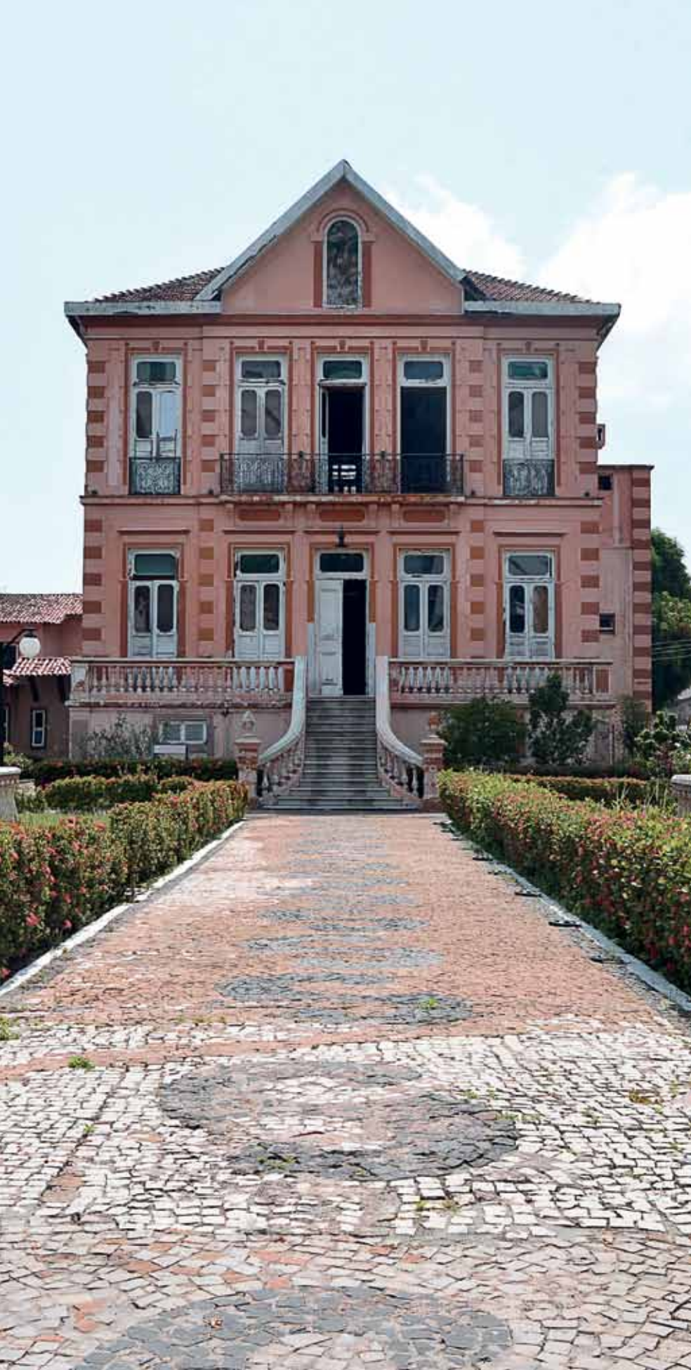
Casarão na avenida Almirante Barroso, em Belém, primeira sede do instituto

das oito seções de pesquisa do instituto, além dos setores de atendimento médico, onde são realizadas quase 25 mil análises clínicas e 4,7 mil diagnósticos de doenças tropicais por ano. À margem da rodovia BR-316, que liga Belém a Maceió, capital alagoana, esse complexo também abriga as atividades de ensino: um curso técnico em análises clínicas e os três cursos de pós-graduação – o mestrado em epidemiologia e vigilância em saúde e o mestrado e o doutorado em virologia. Apenas a Seção de Hepatites fica na sede original do IEC, o casarão do número 492 da avenida Almirante Barroso, em Belém, a 15 km de Ananindeua.