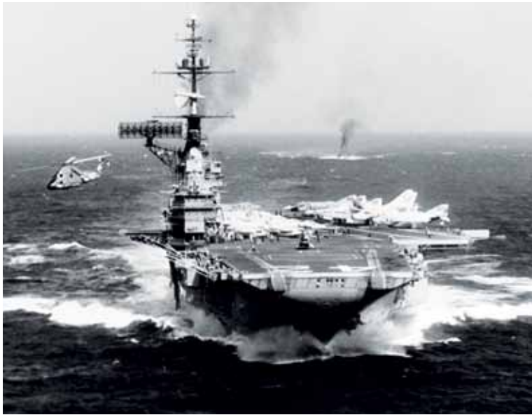
O navio norte-americano Franklin D. próximo ao Vietnã, em 1966