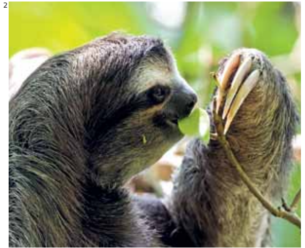
Preguiça-de-coleira, portadora de anticorpos contra o vírus da dengue