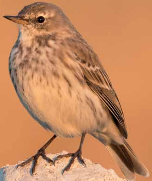
O pássaro monogâmico Anthus spinoletta , encontrado no sul da Europa e da Ásia e analisado no estudo

genes estão ligados ao desenvolvimento neural, à sinalização entre as células e ao aprendizado e à memória. Um cérebro mais adaptável e afeito a reconhecer a família parece essencial à vida a dois e à sobrevivência dos filhotes. O sapinho peruano Ranitomeya imitator foi o único a mostrar diferença no padrão: alguns dos genes menos ativos nas outras espécies monogâmicas estavam mais expressos neles. Especula-se que o anfíbio tenha seguido um rumo evolutivo diferente. Nesses sapos coloridos de pele envenenada, a norma é os pais serem os cuidadores, e não as mães. O estudo propõe a análise ampla de atividade gênica como modo de investigar a evolução de comportamentos complexos. Buscar genes específicos para a origem da monogamia não parece fazer sentido: peixes, anfíbios, aves e mamíferos compartilharam um ancestral há uns 450 milhões de anos. Os genes da monogamia já estavam lá, mas parecem entrar em ação apenas quando o contexto convém à espécie.