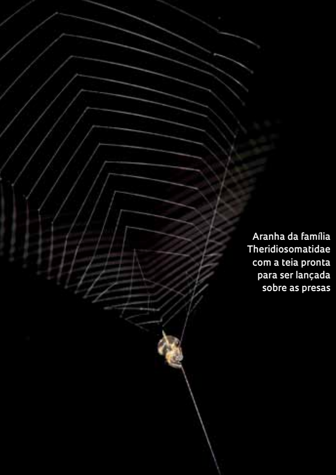
Aranha da família Theridiosomatidae com a teia pronta para ser lançada sobre as presas