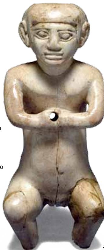
Estatueta de anão, feita em marfim de hipopótamo entre os anos 2200 e 2150 antes de Cristo