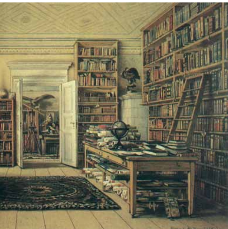
IMAGEM WIKIMEDIA COMMONS INFOGRÁFICO ALEXANDRE AFFONSO

“Humboldt tinha uma formação universal e humanista e desenvolveu estudos em várias áreas até o fim da vida”, diz Mazzari. O naturalista morreu em 1859, aos 89 anos, enquanto trabalhava em seu tratado de ciências humanas e da natureza, Cosmos . O livro foi dividido em cinco volumes — o quinto, incompleto, foi póstumo. ■