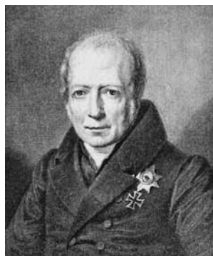
Reformas promovidas pelo filósofo levaram à criação da Universidade de Berlim, em 1810

Os naturalistas aproveitaram a parada para iniciar ali mesmo a expedição. Ficaram na