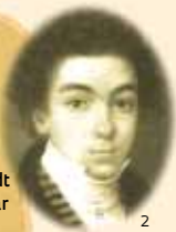
Durante suas viagens, Humboldt conheceu o militar Simón Bolívar

O naturalista alemão viajou pelos rios da Amazônia até a fronteira com o Brasil, mas não a cruzou. Portugal temia que ele fosse um espião e determinou que fosse preso caso entrasse no país