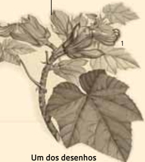
Um dos desenhos feitos por Humboldt com base em suas observações

O naturalista alemão e o botânico francês Aimé Bonpland coletaram mais de 5 mil espécies de plantas. Muitas foram identificadas e descritas durante a viagem