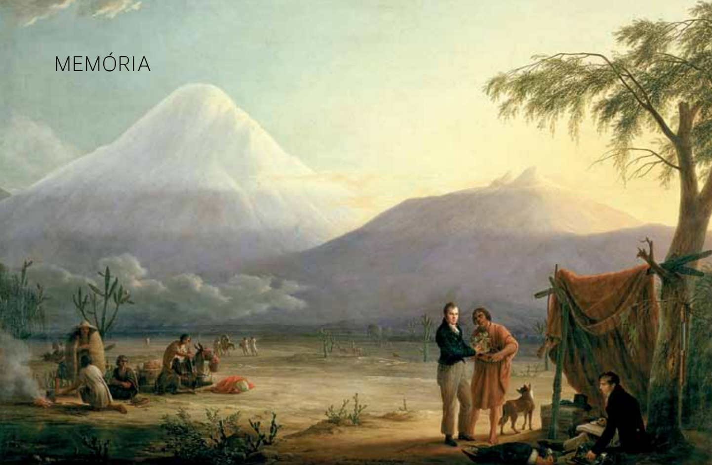
Humboldt ( em pé, à esq. ) e o botânico francês Aimé Bonpland ( sentado ) aos pés do vulcão Chimborazo, no Equador, em quadro do pintor alemão Friedrich Weitsch