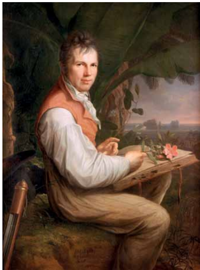
Retrato do naturalista feito por Weitsch em 1806

Essa mudança impulsionou uma concepção de ciência que procurava articular a busca pelo conhecimento puro e o treinamento dos estudantes. Com a introdução desse modelo, a função do professor universitário foi reformulada. Até então, exigia-se que ele dominasse o conhecimento em sua área e que fosse capaz de transmiti-lo a seus alunos. A partir de então, passou-se a exigir que o docente fosse também pesquisador, capaz de produzir novos conhecimentos, além de transmiti-los aos discípulos. Esse modelo logo se disseminou por outras universidades europeias e chegou mais tarde aos países do Novo Mundo.